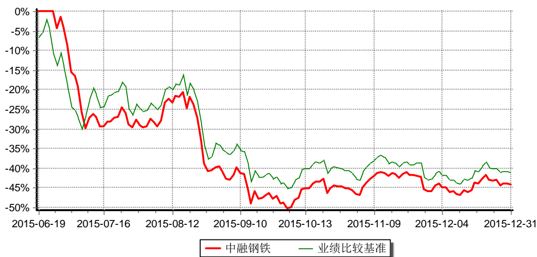
图：中融国证钢铁行业指数分级证券投资基金累计净值增长率与同期业绩比较基准收益率的历史走势对比图