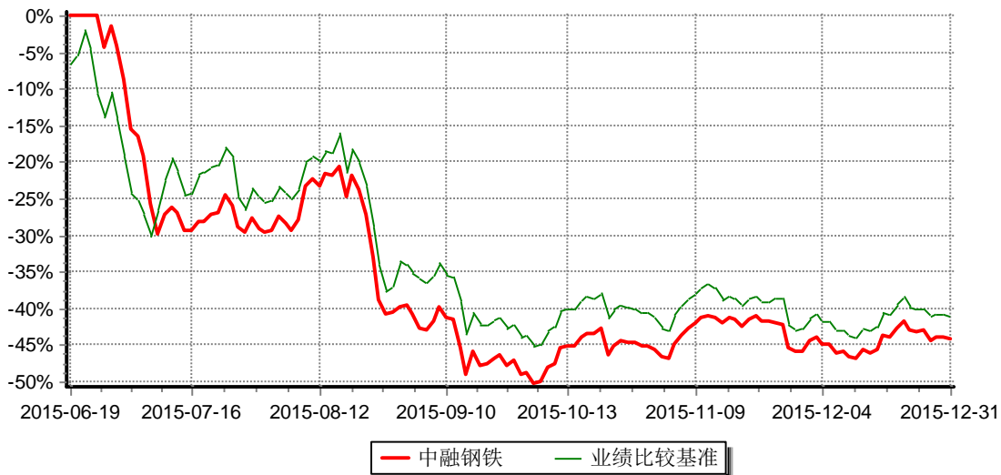
图：中融国证钢铁行业指数分级证券投资基金累计净值增长率与同期业绩比较基准收益率的历史走势对比图