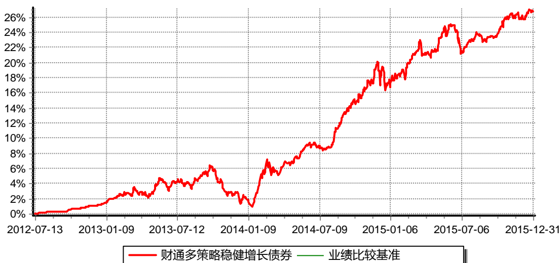
财通多策略稳健增长债券型证券投资基金 累计净值增长率与业绩比较基准收益率历史走势对比图 (2012年7月13日-2015年12月31日)