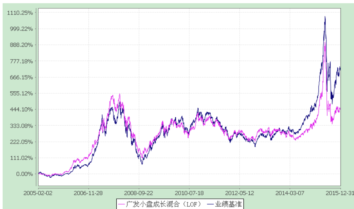
广发小盘成长混合型证券投资基金（LOF） 份额累计净值增长率与业绩比较基准收益率的历史走势对比图 (2005 年 2 月 2 日至 2015 年 12 月 31 日)