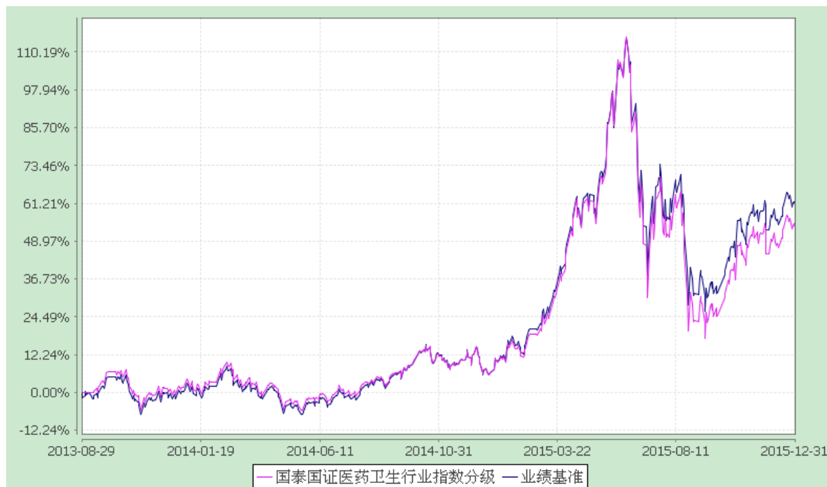
份额累计净值增长率与业绩比较基准收益率的历史走势对比图 (2013 年 8 月 29 日至 2015 年 12 月 31 日)

注：本基金的建仓期为 6 个月，本基金在建仓期结束时，各项资产配置比例符合合同规定。