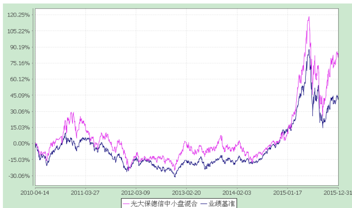
光大保德信中小盘混合型证券投资基金 份额累计净值增长率与业绩比较基准收益率的历史走势对比图 (2010 年 4 月 14 日至 2015 年 12 月 31 日)

注：根据基金合同的规定，本基金建仓期为 2010 年 4 月 14 日至 2010 年 10 月 13 日。建仓期结