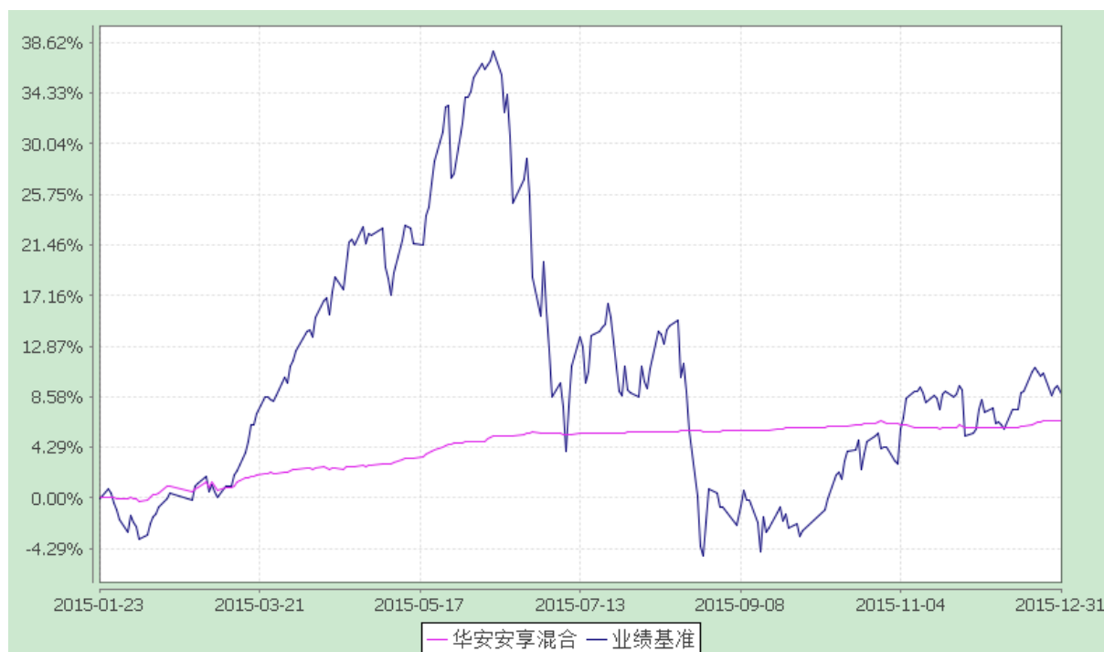
华安安享灵活配置混合型证券投资基金 份额累计净值增长率与业绩比较基准收益率的历史走势对比图 (2015 年 1 月 23 日至 2015 年 12 月 31 日)

注：本基金于 2015 年 1 月 23 日成立，截止本报告期末，本基金成立不满一年。本报告截止日，本基金的各项资产配置比例已符合合同约定。