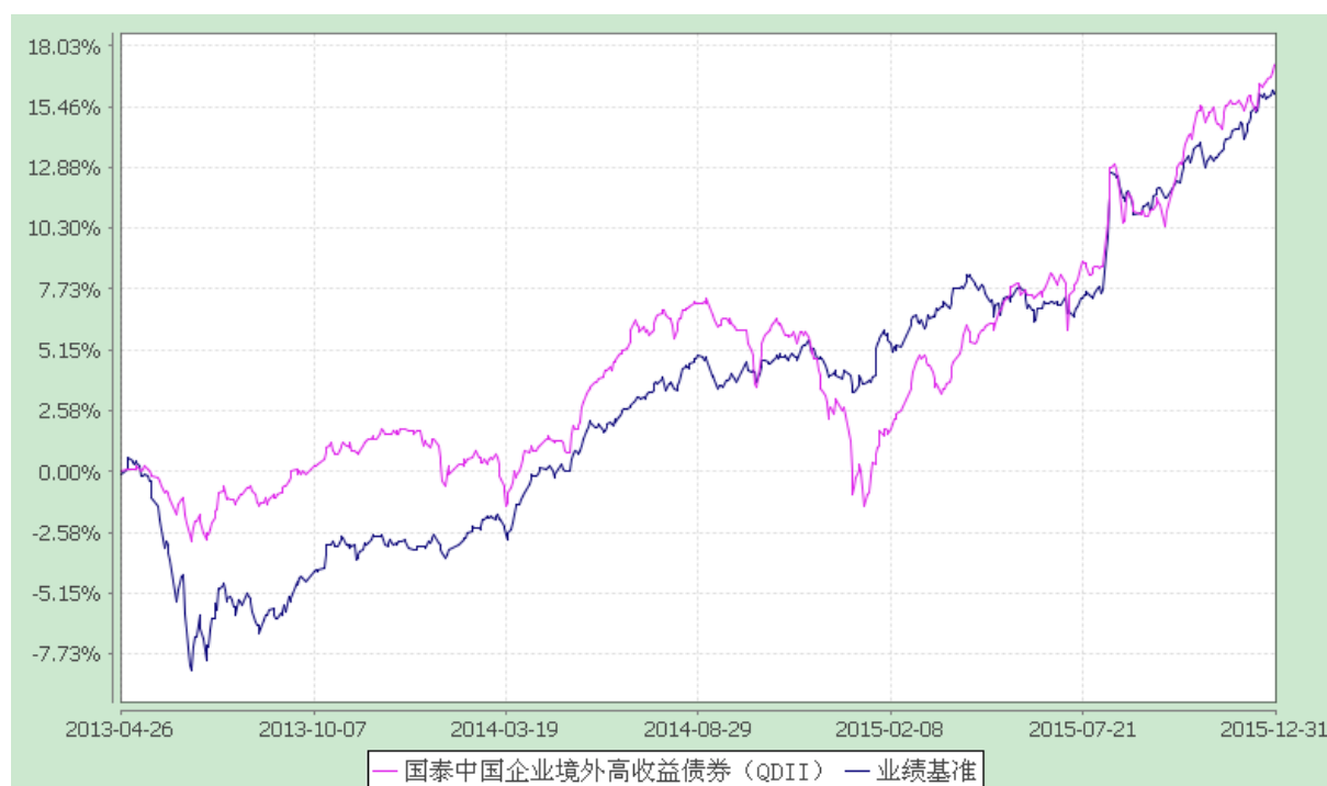
国泰中国企业境外高收益债券型证券投资基金 份额累计净值增长率与业绩比较基准收益率历史走势对比图 (2013 年 4 月 26 日至 2015 年 12 月 31 日)