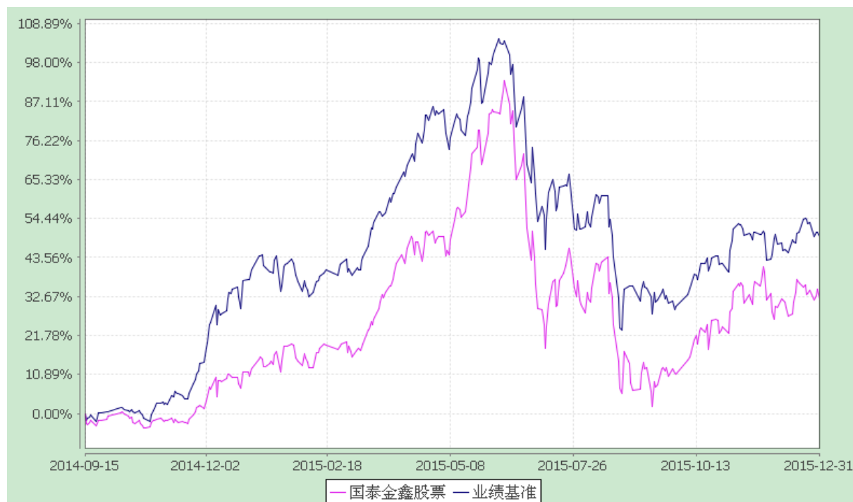
国泰金鑫股票型证券投资基金 份额累计净值增长率与业绩比较基准收益率的历史走势对比图 (2014 年 9 月 15 日至 2015 年 12 月 31 日)