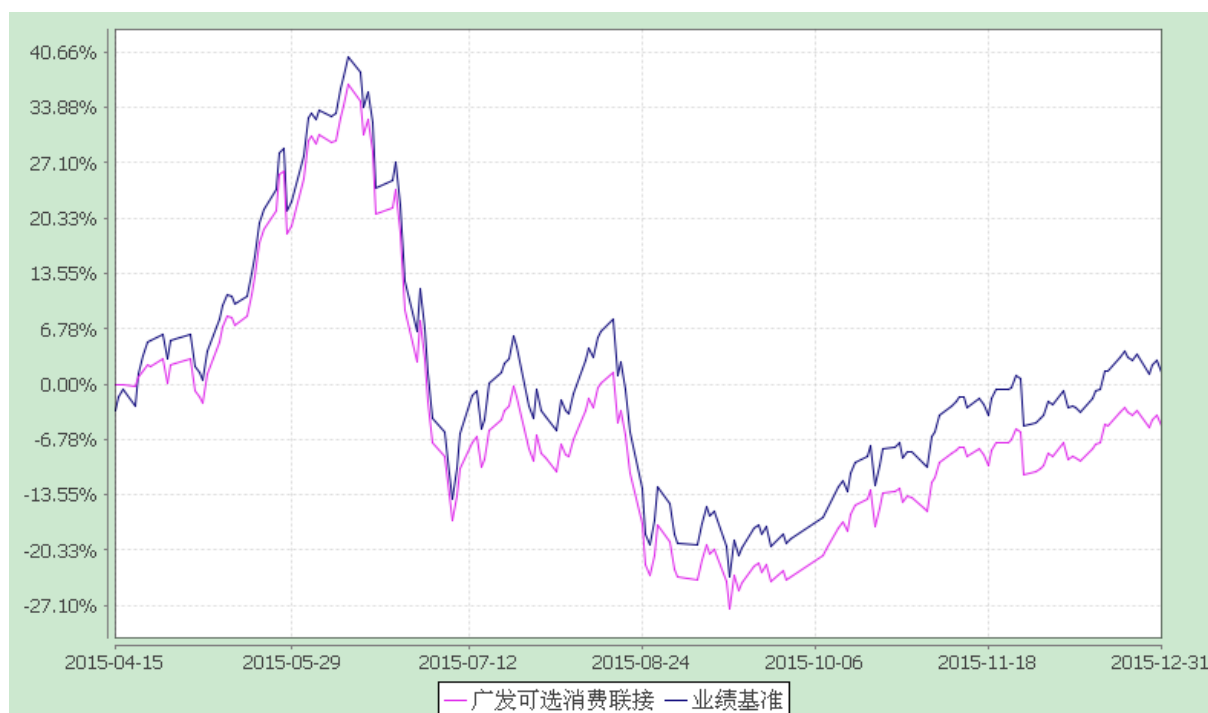
广发中证全指可选消费交易型开放式指数证券投资基金发起式联接基金 份额累计净值增长率与业绩比较基准收益率的历史走势对比图 (2015 年 4 月 15 日至 2015 年 12 月 31 日)

注：（1）本基金合同生效日期为 2015 年 4 月 15 日，至披露时点本基金成立未满一年。