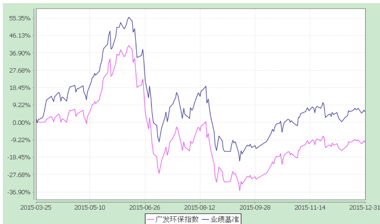
广发中证环保产业指数型发起式证券投资基金 份额累计净值增长率与业绩比较基准收益率的历史走势对比图 (2015年3月25日至2015年12月31日)

注：1、本基金合同生效日期为 2015 年 3 月 25 日，只披露时点本基金成立未满一年。