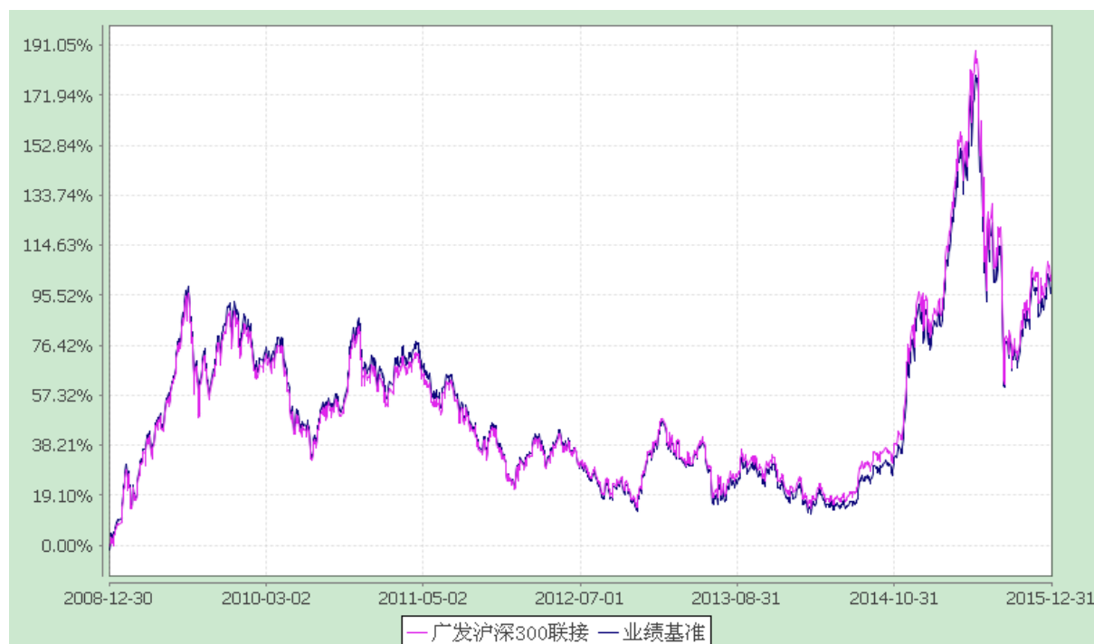
广发沪深 300 交易型开放式指数证券投资基金联接基金 份额累计净值增长率与业绩比较基准收益率的历史走势对比图 (2008 年 12 月 30 日至 2015 年 12 月 31 日)