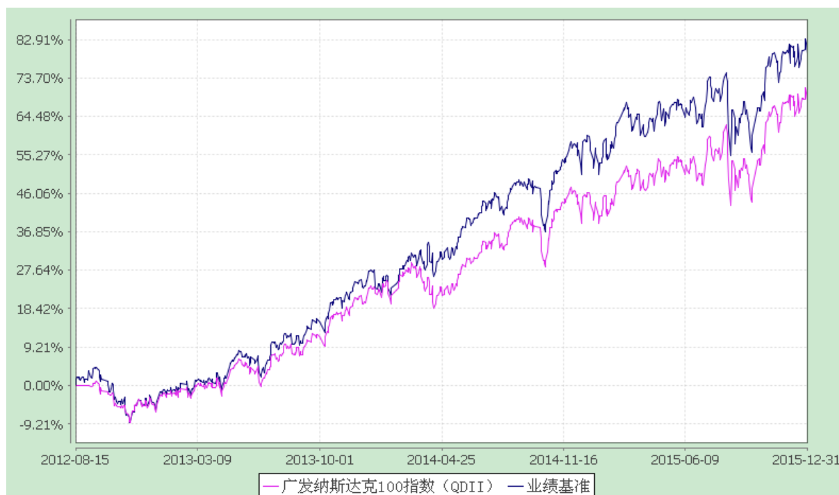
广发纳斯达克 100 指数证券投资基金 份额累计净值增长率与业绩比较基准收益率历史走势对比图 (2012 年 8 月 15 日至 2015 年 12 月 31 日)