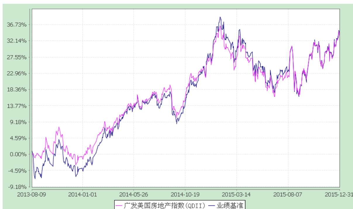
广发美国房地产指数证券投资基金 份额累计净值增长率与业绩比较基准收益率历史走势对比图 (2013 年 8 月 9 日至 2015 年 12 月 31 日)