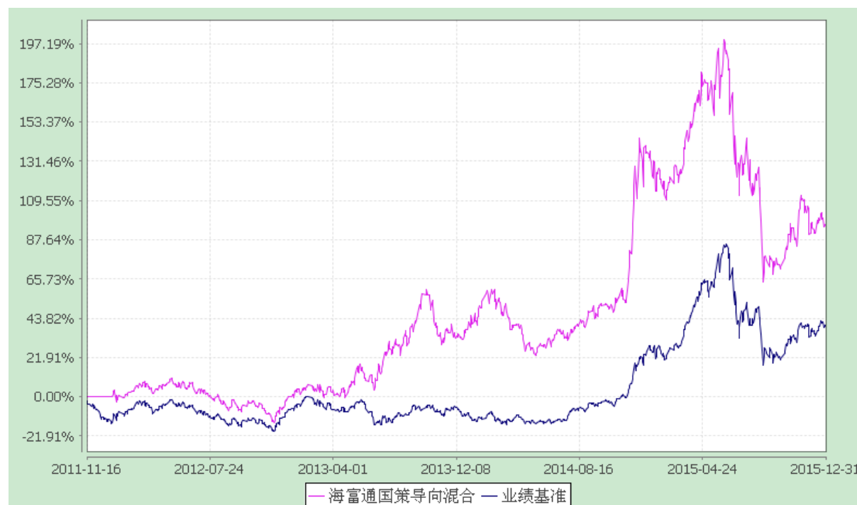
海富通国策导向混合型证券投资基金 份额累计净值增长率与业绩比较基准收益率的历史走势对比图 (2011年11月16日至2015年12月31日)

注：按照本基金合同规定，本基金建仓期为基金合同生效之日起六个月。截至报告期末本基金的各项投资比例已达到基金合同第十四部分（二）投资范围、（七）投资限制中规定的各项比例。