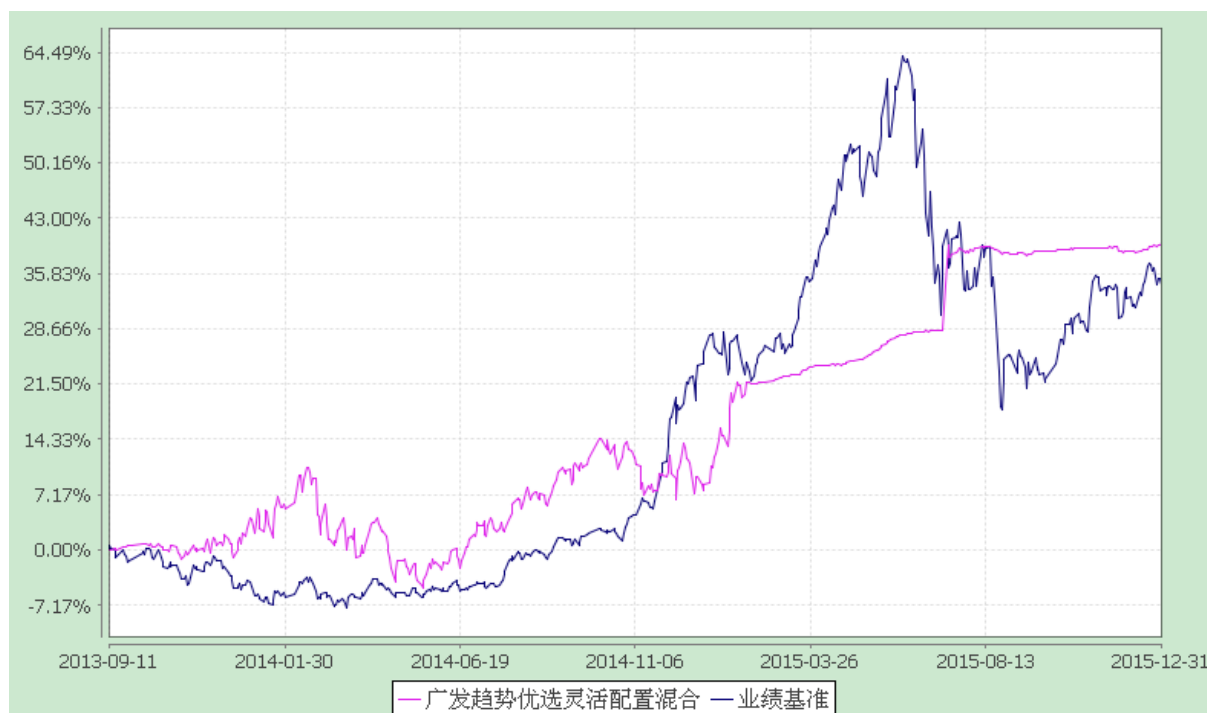
广发趋势优选灵活配置混合型证券投资基金 份额累计净值增长率与业绩比较基准收益率的历史走势对比图 (2013 年 9 月 11 日至 2015 年 12 月 31 日)