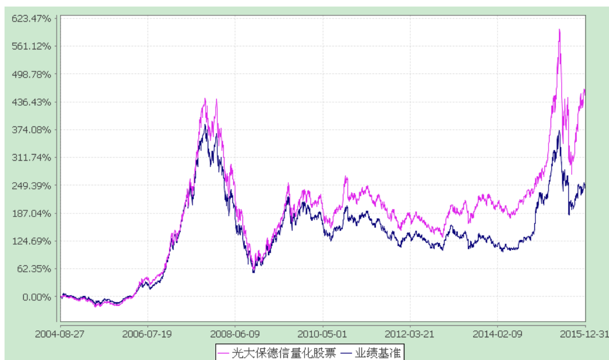
光大保德信量化核心证券投资基金 份额累计净值增长率与业绩比较基准收益率的历史走势对比图 (2004 年 8 月 27 日至 2015 年 12 月 31 日)

注：根据基金合同的规定，本基金建仓期为 2004 年 8 月 27 日至 2005 年 2 月 26 日。建仓期结束时本基金各项资产配置比例符合本基金合同规定的比例限制及投资组合的比例范围。