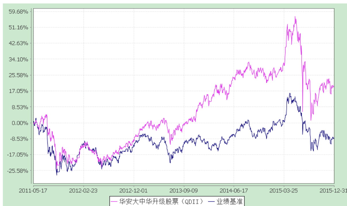
华安大中华升级股票型证券投资基金 自基金合同生效以来份额累计净值增长率与业绩比较基准收益率历史走势对比图 (2011 年 5 月 17 日至 2015 年 12 月 31 日)

注: 根据《华安大中华升级股票型证券投资基金基金合同》规定, 本基金建仓期不超过 6 个月。