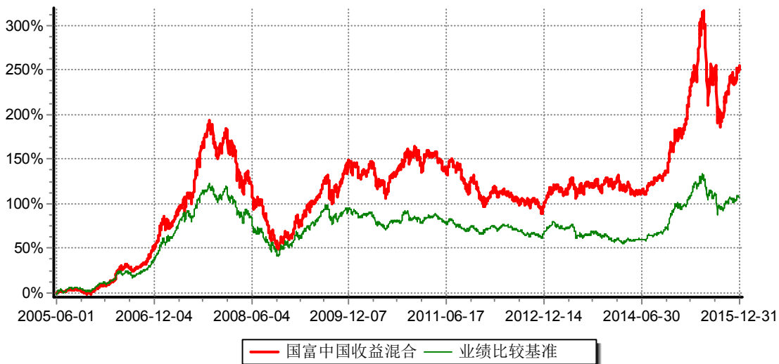
富兰克林国海中国收益证券投资基金 份额累计净值增长率与业绩比较基准收益率历史走势对比图 （2005年6月1日-2015年12月31日）

注：本基金的基金合同生效日为2005年6月1日。本基金在建仓期结束时，各项投资比例符合基金合同约定。