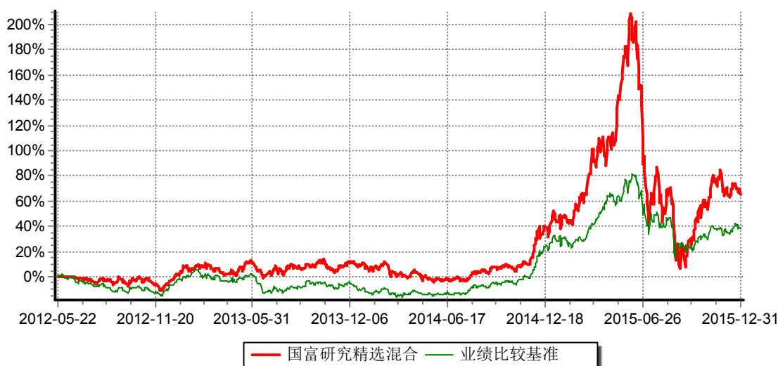
富兰克林国海研究精选混合型证券投资基金 份额累计净值增长率与业绩比较基准收益率历史走势对比图 (2012年5月22日-2015年12月31日)

注：本基金的基金合同生效日为2012年5月22日。本基金在6个月建仓期结束时，各项投资比例符合基金合同约定。