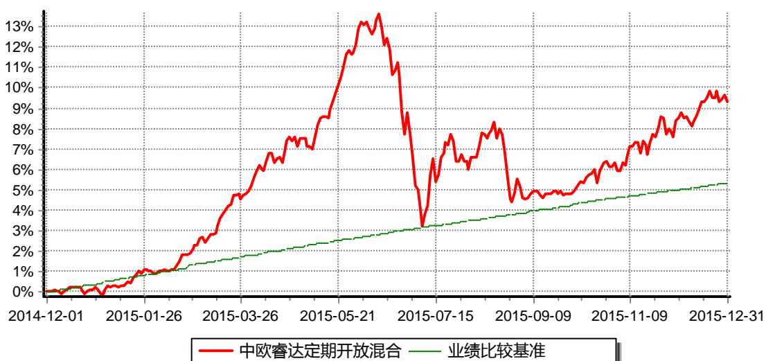
中欧睿达定期开放混合型发起式证券投资基金 份额累计净值增长率与业绩比较基准收益率历史走势对比图 (2014年12月1日-2015年12月31日)