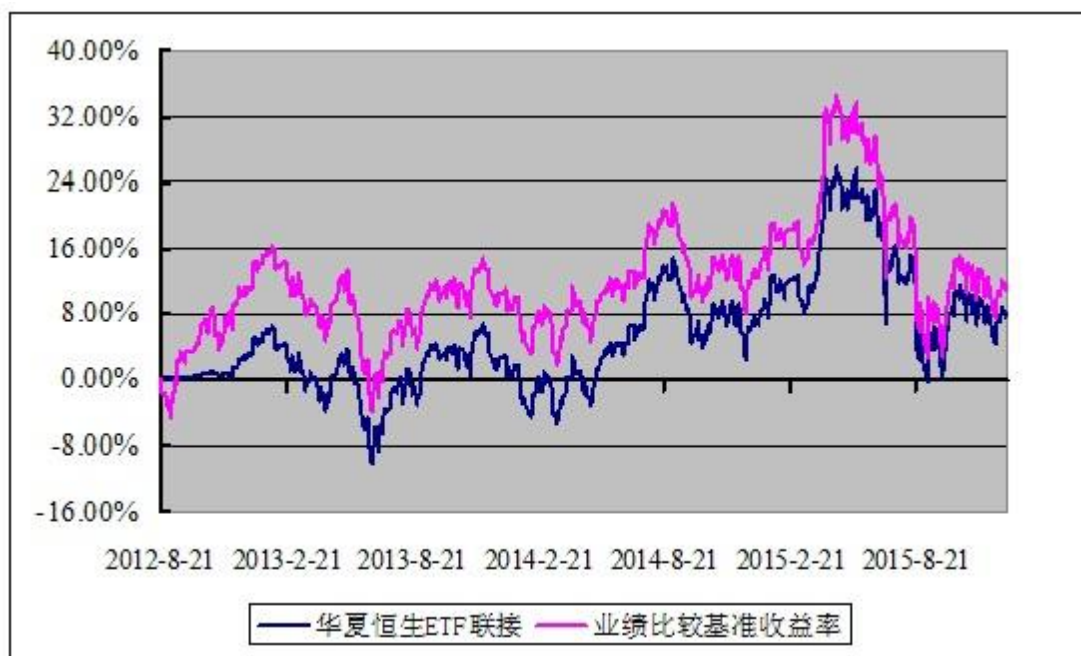
恒生交易型开放式指数证券投资基金联接基金 份额累计净值增长率与业绩比较基准收益率历史走势对比图 (2012 年 8 月 21 日至 2015 年 12 月 31 日)