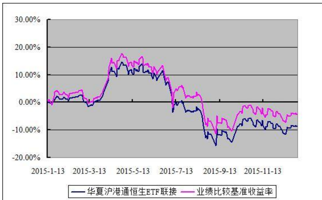
华夏沪港通恒生交易型开放式指数证券投资基金联接基金 份额累计净值增长率与业绩比较基准收益率历史走势对比图 (2015 年 1 月 13 日至 2015 年 12 月 31 日)