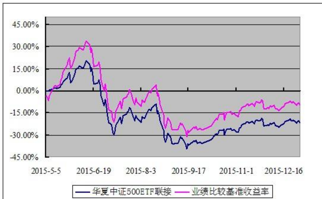
华夏中证 500 交易型开放式指数证券投资基金联接基金 份额累计净值增长率与业绩比较基准收益率历史走势对比图 (2015 年 5 月 5 日至 2015 年 12 月 31 日)