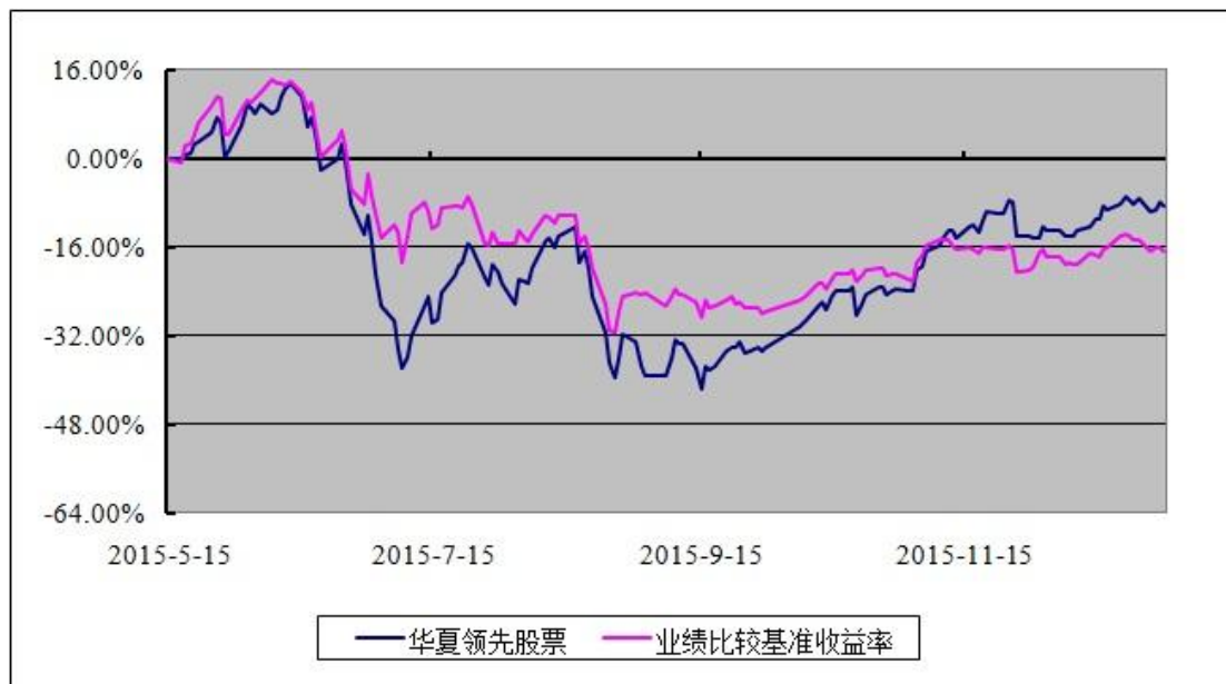
华夏领先股票型证券投资基金 份额累计净值增长率与业绩比较基准收益率历史走势对比图 (2015 年 5 月 15 日至 2015 年 12 月 31 日)