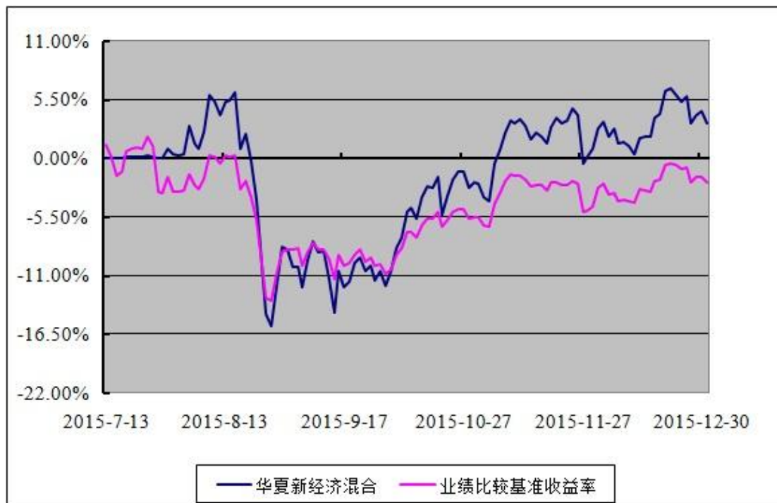
华夏新经济灵活配置混合型发起式证券投资基金 份额累计净值增长率与业绩比较基准收益率历史走势对比图 (2015 年 7 月 13 日至 2015 年 12 月 31 日)