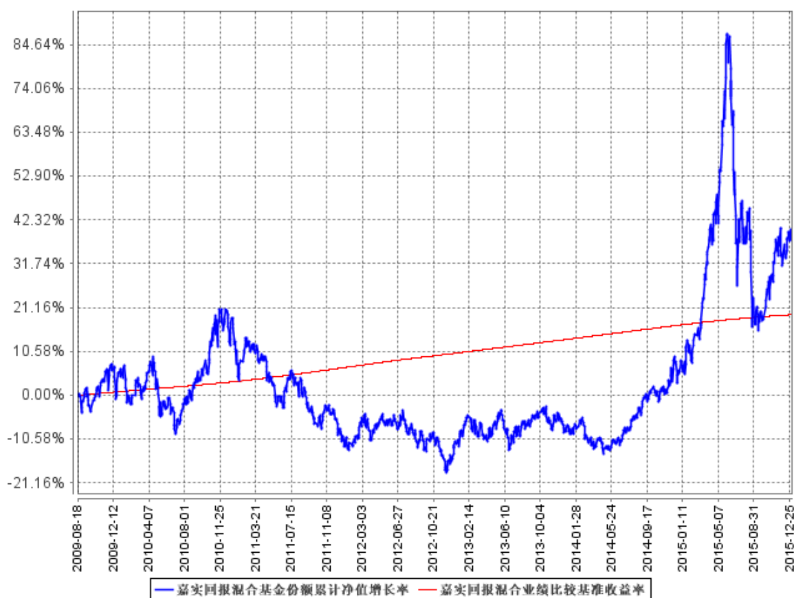
图：嘉实回报混合基金份额累计净值增长率与同期业绩比较基准收益率的历史走势对比图