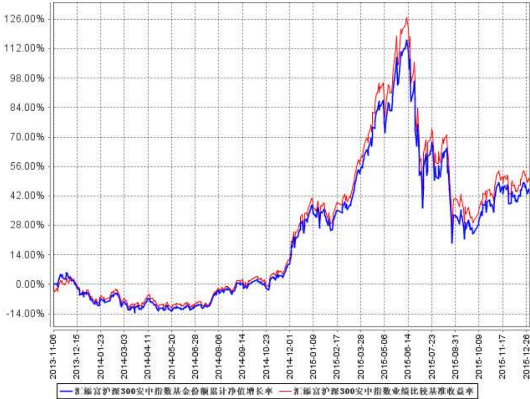
汇添富沪深300安中指数基金份额累计净值增长率与同期业绩比较基准收益率的历史走势对比图

注：本基金建仓期为本《基金合同》生效之日（2013年11月6日）起6个月，建仓期结束时各项资产配置比例符合合同规定。