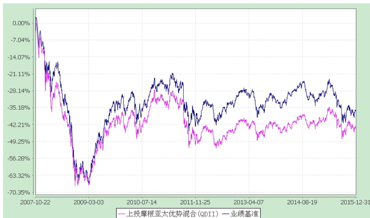
上投摩根亚太优势混合型证券投资基金 自基金合同生效以来份额累计净值增长率与业绩比较基准收益率历史走势对比图 (2007 年 10 月 22 日至 2015 年 12 月 31 日)

注：1.本基金合同生效日为 2007 年 10 月 22 日，图示时间段为 2007 年 10 月 22 日至 2015 年 12 月 31 日。