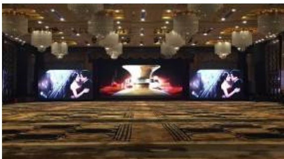
（上图：深圳大中华喜来登酒店）

经过2015年对公司战略的梳理，公司明确将显示屏酒店运营作为公司场景运营商业模式的一个重要领域，并从2015年第二季度开始深入调研和分析此业务，查找了前期的失误，逐步理清了如何选择酒店、如何定价、如何考核团队、如何管理合作伙伴、如何提升酒店的积极性等关系到运营效益的因素，并通过多种手段不断解决之前部分显示屏运营不佳的问题，在收取显示屏使用租金的基础上，也设想未来包括广告、视频直播、会务服务、互动娱乐等多种盈利模式，并探索了与北京云动数字媒体技术有限公司的合作，盈利模式逐渐清晰。截止报告期末，公司已累计签约酒店197家（其中四星级和五星级酒店合计180家），已安装显示屏300块（其中四星级和五星级酒店合计269块），已实际运营的为295块（其中四星级和五星级酒店合计264块），运营的酒店档次比最初明显提升。报告期内，显示屏酒店运营业务实现租金收入577.59万元，另有部分租金尚在确认收入过程中，2015年第4季度单季收入超过了前三季度的收入总和。2015年，公司显示屏先后进驻了国内一线城市的香格里拉酒店、希尔顿酒店、喜来登酒店、皇冠假日酒店、凯宾斯基酒店等高端酒店。