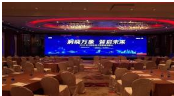
（上图：深圳福田香格里拉酒店）

经历2015年“蜕变”的艰辛。实现营业总收入101,353.86万元，比上年同期下降6.11%；实现净利润12,745.32万元，比上年同期下降19.76%，其中，归属于上市公司股东的净利润12,553.48万元，比上年同期下降20.97%。2015年公司出口收入82,370.32万元，占公司营业总收入的81.42%。2015年公司实现小间距显示屏接单约3.37亿元，同比增长约47%，约占全部显示屏订单的33%。