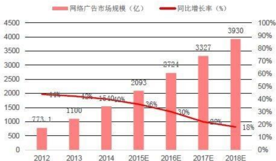
图 2：网络广告市场规模及增长率