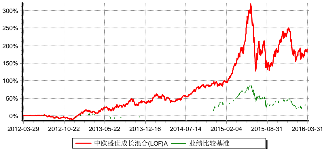
累计份额净值增长率与业绩比较基准收益率历史走势对比图 (2012年3月29日-2016年3月31日)