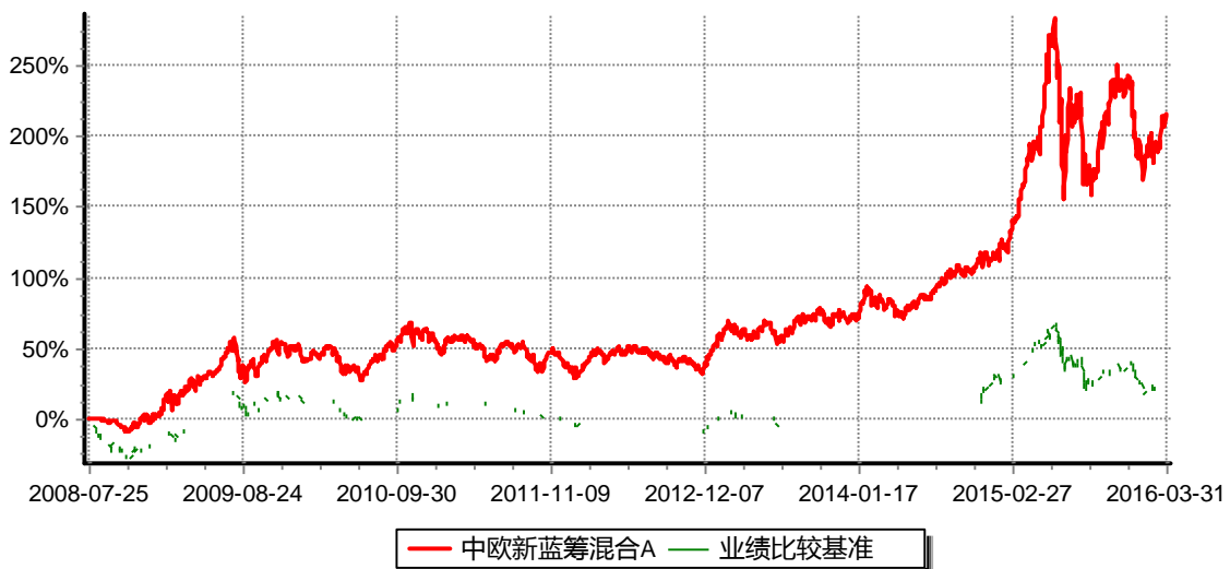
累计净值增长率与业绩比较基准收益率历史走势对比图 (2008年07月25日-2016年3月31日)