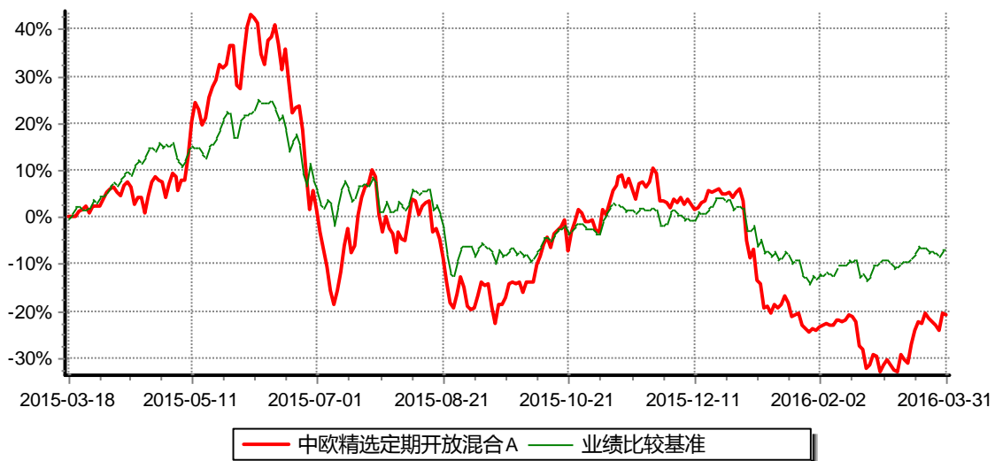
中欧精选定期开放混合A 基金累计净值增长率与业绩比较基准收益率历史走势对比图 (2015年03月18日-2016年3月31日)

注：本基金基金合同生效日期为2015年3月18日，按基金合同的规定，本基金自基金合同生效起六个月为建仓期，建仓期结束时本基金的各项资产配置比例已达到基金合同的规定。