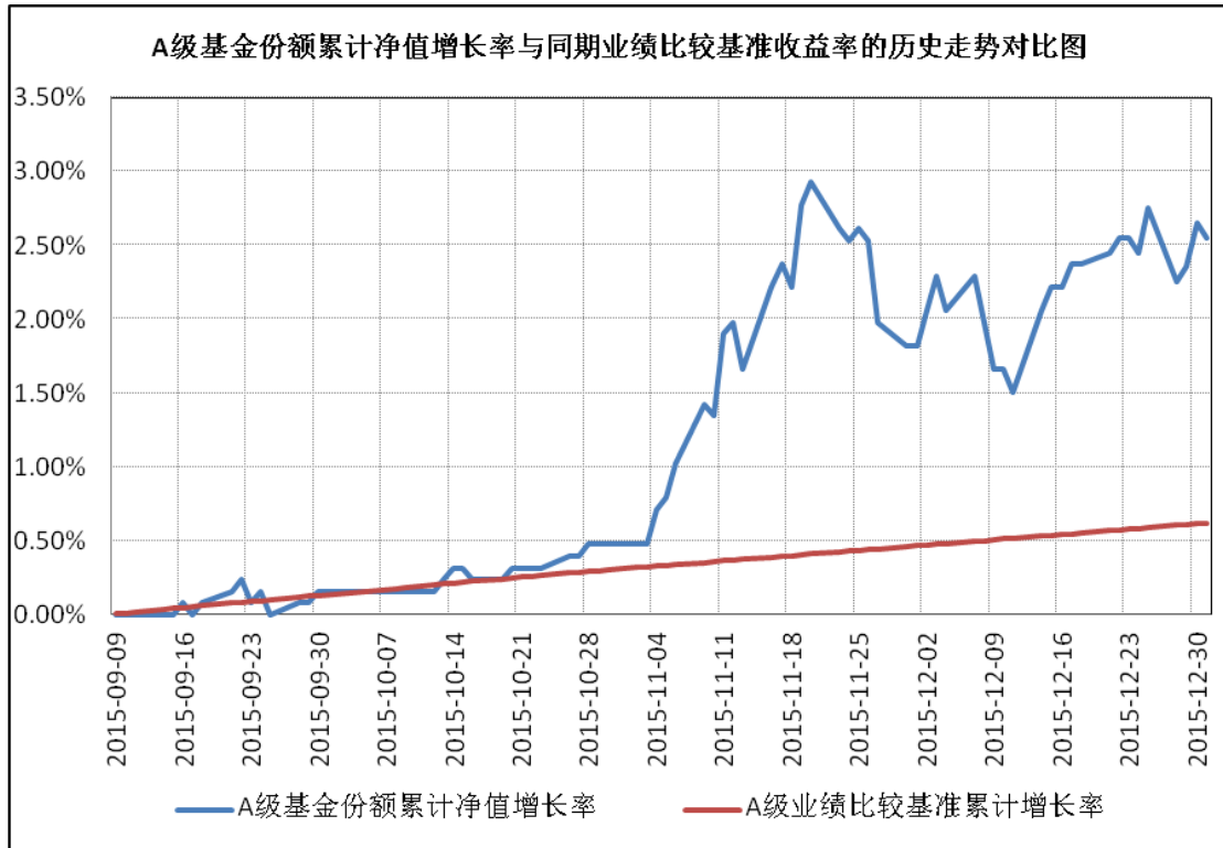
(二) 基金自基金合同生效以来基金累计净值收益率与业绩比较基准收益率历史走势对比图 (2015年9月9日-2015年12月31日)