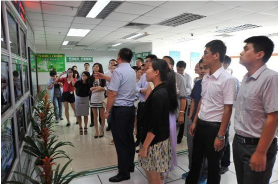
图 1:调研人员一行通过信息监控平台了解公司产业情况