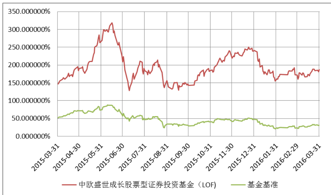
中欧盛世成长混合型证券投资基金（LOF）基金 E 类份额 累计净值增长率变动及其与同期业绩比较基准收益率变动的比较 （2015 年 10 月 8 日至 2016 年 3 月 31 日）