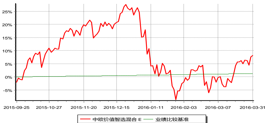
中欧价值智选回报混合型证券投资基金 E 类份额 累计份额净值增长率与业绩比较基准收益率的历史走势对比图 （2015年09月25日-2016年3月31日）

注：自 2015 年 9 月 22 日起，本基金增加 E 类份额。图示业绩展示区间为自该基金份额运作日 2015 年 9 月 25 日起至 2015 年 9 月 30 日。