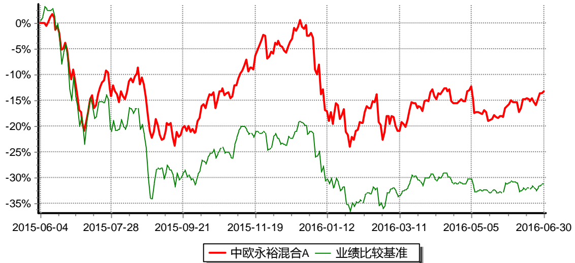
累计净值增长率与业绩比较基准收益率历史走势对比图 (2015年06月04日-2016年06月30日)

注：本基金基金合同生效日为2015年6月4日，按基金合同的规定，本基金自基金合同生效起六个月为建仓期，建仓期结束时本基金的各项资产配置比例已达到基金合同的规定。