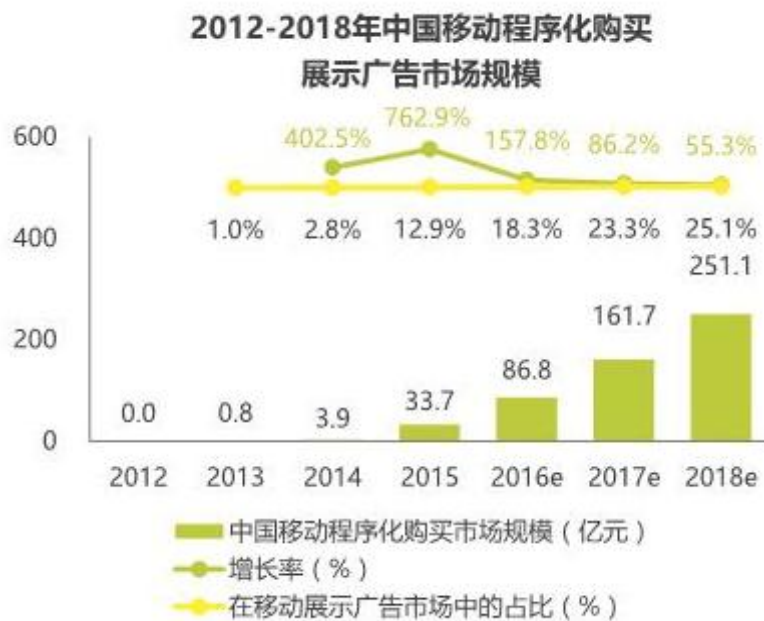
图 3：中国移动程序化购买展示广告市场规模趋势