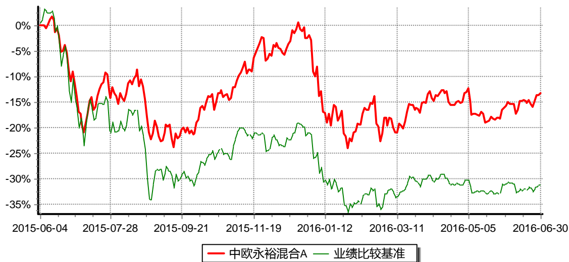
累计净值增长率与业绩比较基准收益率历史走势对比图 (2015年06月04日-2016年06月30日)

注：本基金基金合同生效日为2015年6月4日，按基金合同的规定，本基金自基金合同生效起六个月为建仓期，建仓期结束时本基金的各项资产配置比例已达到基金合同的规定。