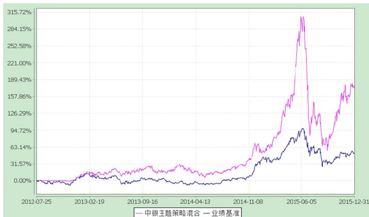
中银主题策略混合型证券投资基金 份额累计净值增长率与业绩比较基准收益率的历史走势对比图 (2012年7月25日至2015年12月31日)