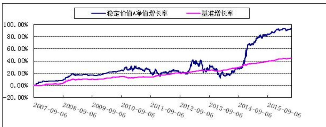
博时稳定价值债券 B