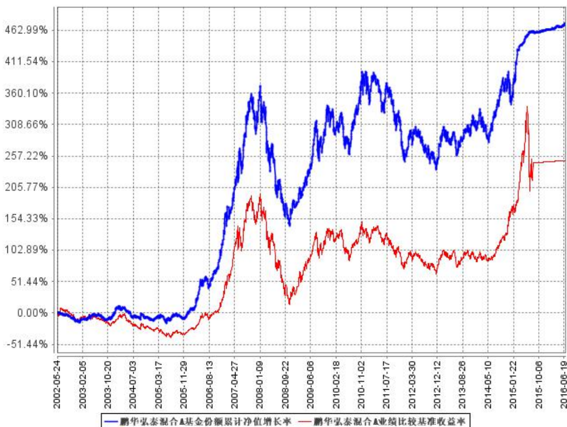
鹏华弘泰混合A基金份额累计净值增长率与同期业绩比较基准收益率的历史走势对比图