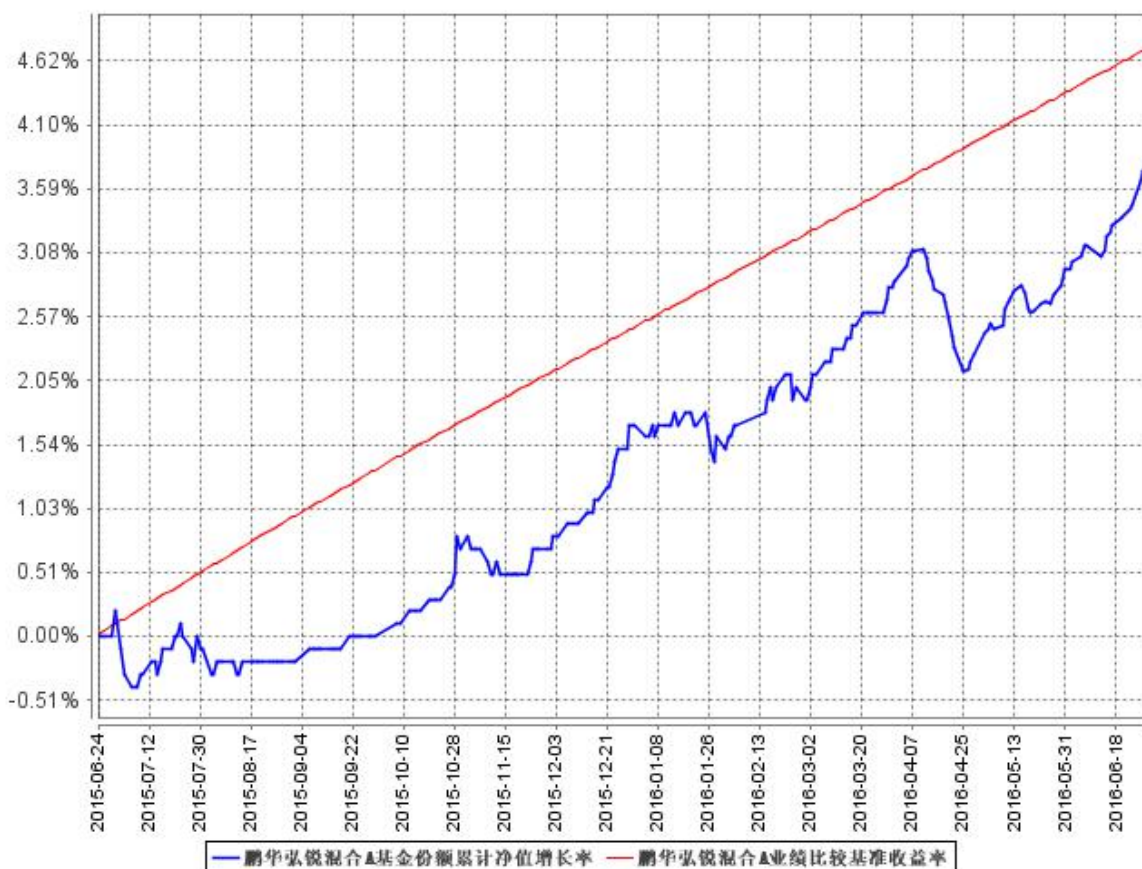
鹏华弘锐混合A基金份额累计净值增长率与同期业绩比较基准收益率的历史走势对比图