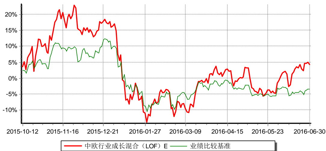
中欧行业成长混合型证券投资基金（LOF）E类份额 累计份额净值增长率与业绩比较基准收益率历史走势对比图 （2015年10月12日-2016年6月30日）

注：自2015年10月8日起，本基金增加E类份额。图示日期为2015年10月12日至2016年6月30日。