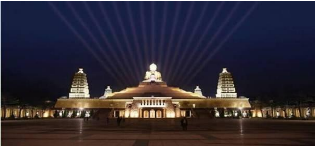
佛光山佛陀纪念馆