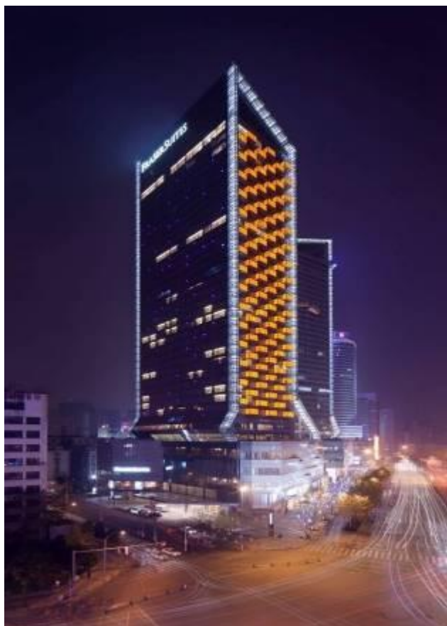
成都仁恒置地广场