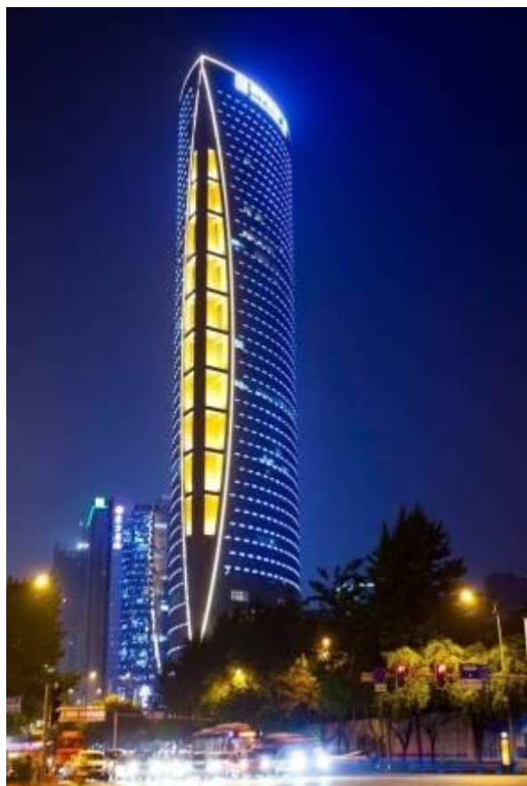
成都明宇金融广场