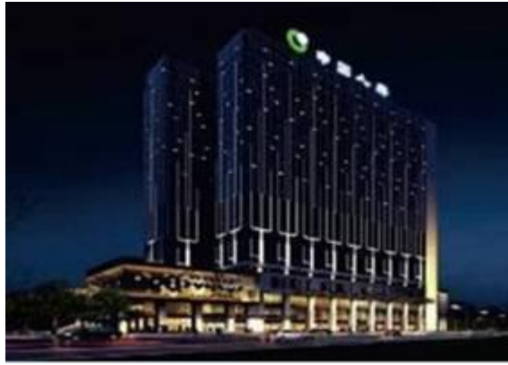
中国人寿陕西分公司综合楼亮化工程