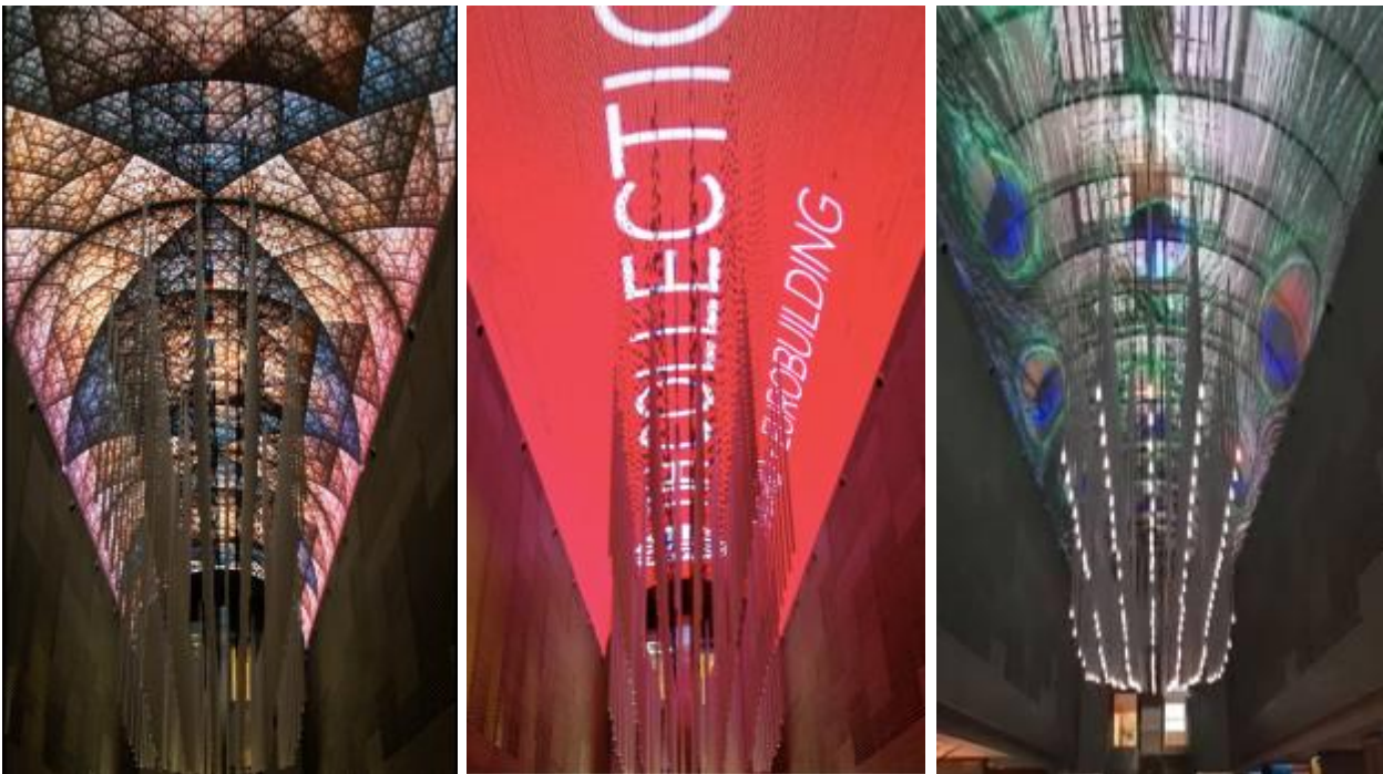
西班牙马德里NH Eurobuildind（欧洲最大规模创意LED天幕）