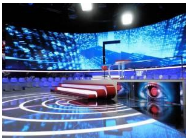
西班牙电视台12+1节目演播厅