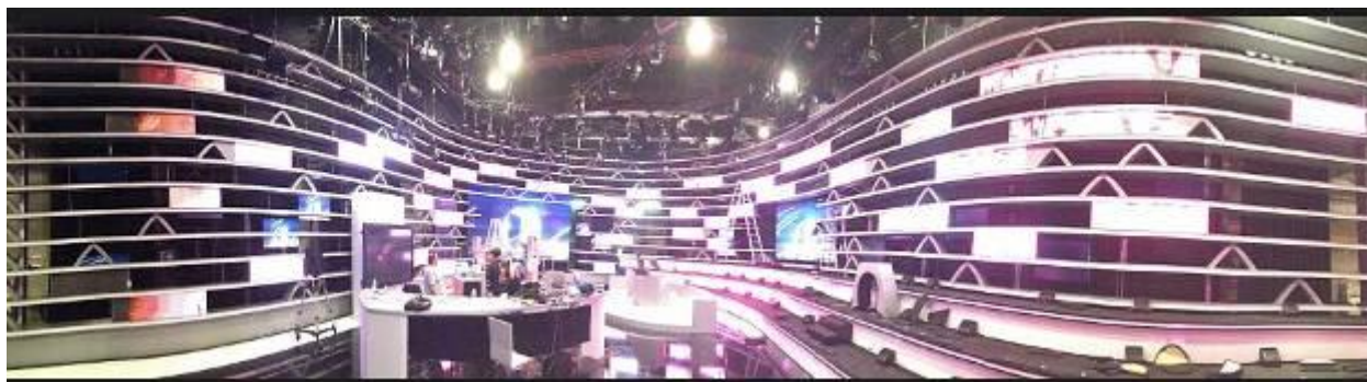
法国巴黎 Euro Media演播厅