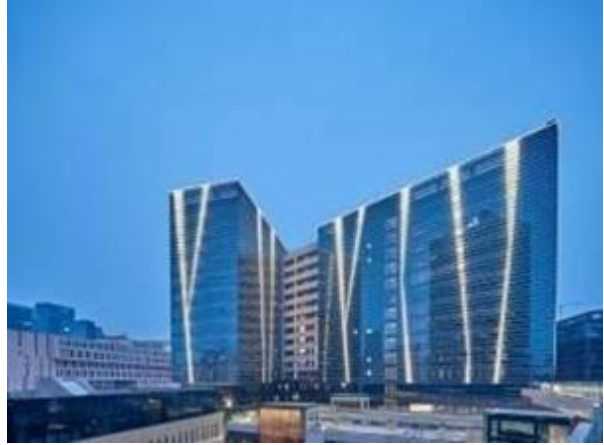
阿里巴巴全景和写字楼