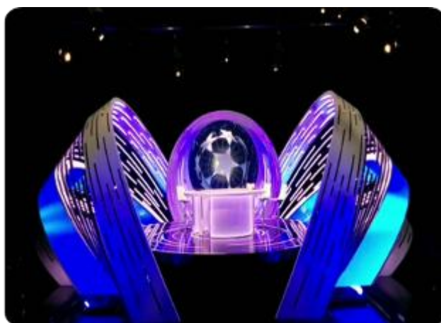
多哈电视台 - Al Jazeera体育频道演播厅