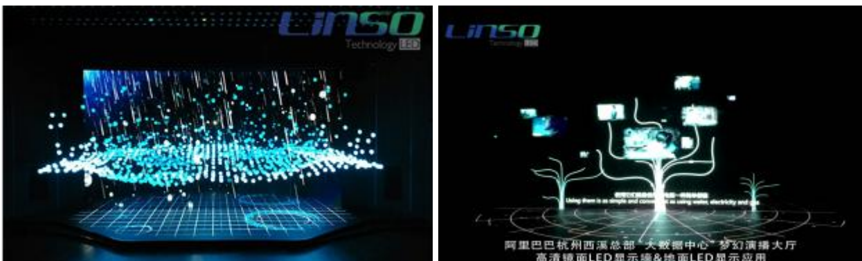
杭州阿里巴巴总部数据中心—梦幻剧场高清镜面LED大屏&地面屏