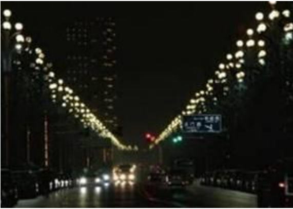
重庆市南滨路如意灯