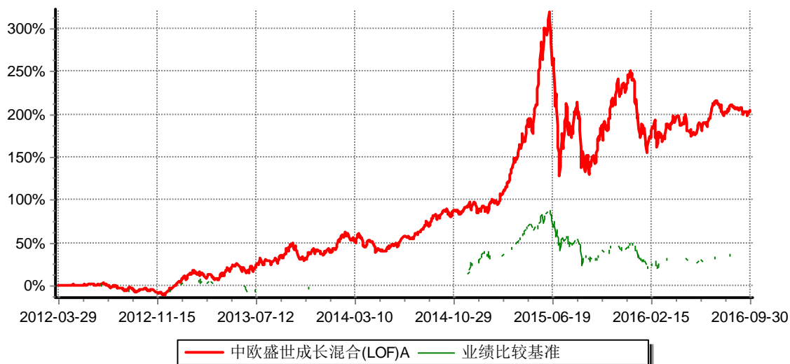
中欧盛世成长混合型证券投资基金（LOF）A 累计净值增长率与业绩比较基准收益率历史走势对比图 （2012年3月29日-2016年9月30日）