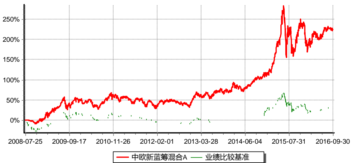
累计净值增长率与业绩比较基准收益率历史走势对比图 (2008年07月25日-2016年9月30日)