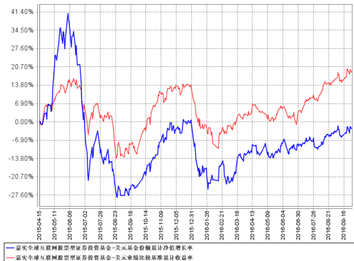
图 2: 嘉实全球互联网股票-美元基金份额累计净值增长率与同期业绩比较基准收益率的历史走势对比图